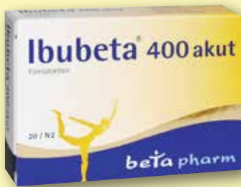
Ibubeta® 400 akut 20 Stück

Schon der Schriftsteller von Kotzebue fand: „Die Sonne ist die Universalarznei aus der Himmelsapotheke.“ Stimmt, doch wie für jede Medizin gilt auch dabei: Auf die richtige Anwendung kommt es an. Was Sonnenanbeter beachten müssen, erfahren Sie deshalb in Ihrer Guten Tag Apotheke und in der aktuellen Ausgabe unseres Gesundheitratgebers MEIN TAG. Freuen Sie sich also auf eine unbeschwerte Sommer-Sonnen-Zeit!