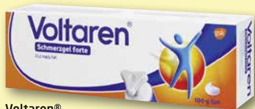
Voltaren® Schmerzgel forte