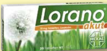
Lorano® akut 20 Tabletten