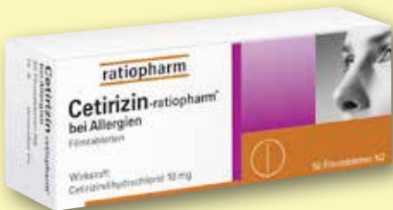
Cetirizin-ratiopharm® bei Allergien 10 mg