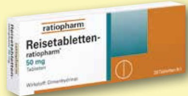
Reisetabletten-ratiopharm® 50 mg