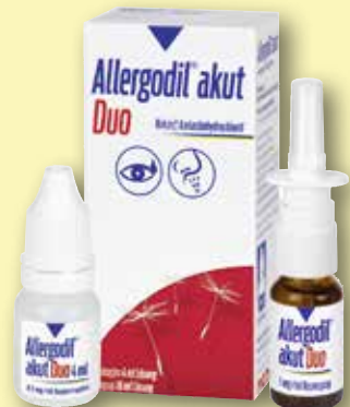
Allergodil® akut Duo Augentropfen und Nasenspray

Achten Sie auf weitere Angebote in unserer Apotheke!